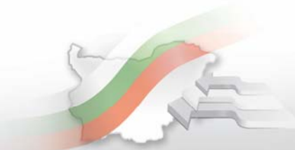
Износ, внос и търговско салдо по групи страни и основни търговски страни партньори 1 за 2010 и 2011 2 г.