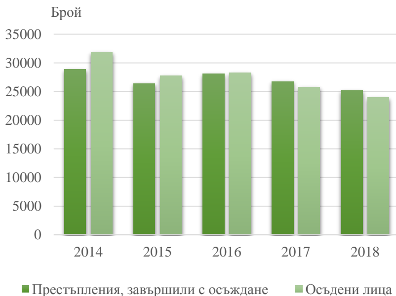
Фиг. 1. Престъпления, завършили с осъждане, и осъдени лица през периода 2014 - 2018 година

Броят на осъдените лица с влезли в сила присъди през 2018 г. е 23 973, което е със 7.1% по-малко в сравнение с 2017 година.