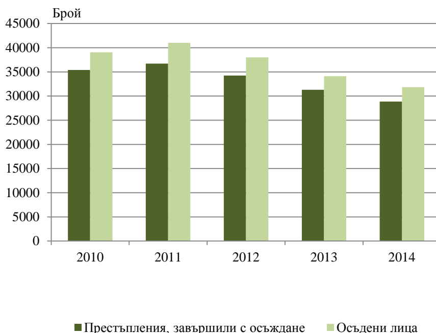
Фиг. 1. Престъпления, завършили с осъждане, и осъдени лица през периода 2010 - 2014 година